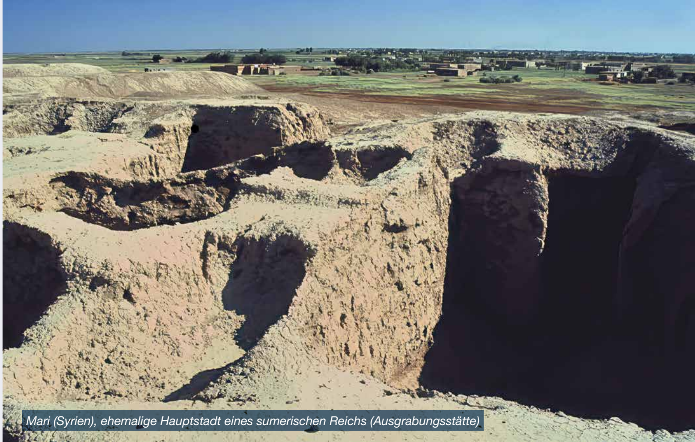
Mari (Syrien), ehemalige Hauptstadt eines sumerischen Reichs (Ausgrabungsstätte)

im Monat Sugar!“ (Authentischer Text einer Museums-Tontafel, ca. 2500 vor Christus aus Adab.)