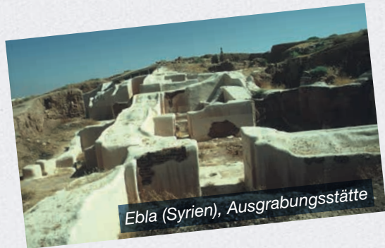
Ebla (Syrien), Ausgrabungsstätte

das Alltagsleben im alten Syrien exakt so wie die fünf Bücher Mose, mit denen das Alte Testament beginnt. Namen aus der Bibel tauchen ganz selbstverständlich als historische Personen-Namen auf den Ebla-Tafeln auf. Wir begegnen Heber aus 1. Mose (Kapitel 11,14-17), Abraham und Israel, den großen alten Männern des Volkes. Keilschrift-Bibliotheken und Archive aus der Osttürkei, Syrien, dem Iran und dem Irak untermauern die geschichtlichen Aussagen der Bibel. Sie dürfen als absolut authentisch gelten.