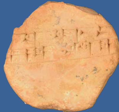
Keilschrifttafel, ca. 2500 v. Chr., eine typische Schüler-Übungstontafel zum Erlernen dieser Silbenschrift.

Menschen schreiben. Das sind immerhin 800 Jahre, bevor Abraham lebte! Das zeigt, wie unsinnig die Theorie ist, dass alle Erzählungen in der Bibel nur mündlich überliefert und nach und nach durchs Erzählen verfälscht worden wären. Viele Menschen zur Zeit Abrahams und Moses konnten in jenen Ländern schreiben. Sie schrieben viel und gern. Das zeigt uns die ungeheure Menge der Tontafeln, die die Jahrtausende überstanden haben.