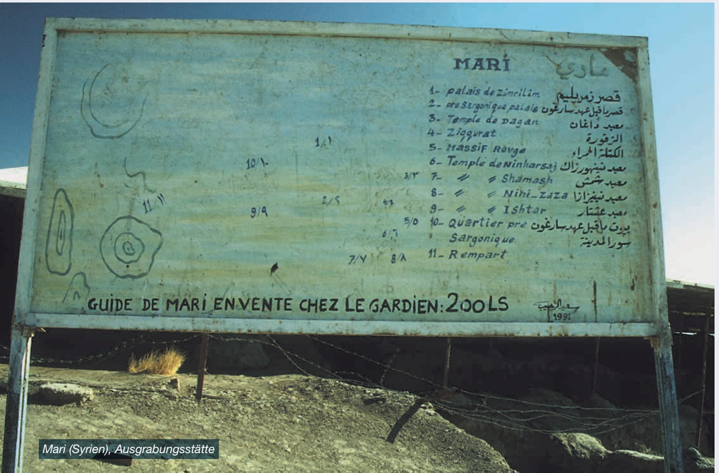
Mari (Syrien), Ausgrabungsstätte