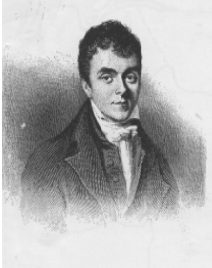
Das letzte Portrait Henry Martyns

Martyn war sich der Zartheit seiner Konstitution immer bewusst und wusste nur zu gut, dass ihm nicht viele Lebensjahre beschieden sein würden.