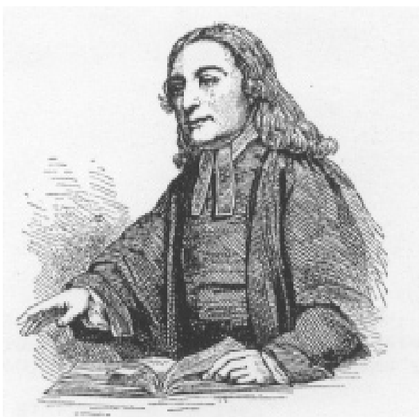
John Wesley (1703–1791)

John Wesley reiste unermüdlich zu Pferd durch Großbritannien, durch Stadt und Land, und verkündigte die Gute Botschaft, die dann durch Gottes Gnade geistliche Erweckungen hervorrief. Seine ausgedehnte Predigt- und Lehrtätigkeit führte viele zu voller Hingabe an den Herrn. Er und sein Bruder Charles, ein bekannter Liederdichter, haben das Aussehen Englands im 18. Jahrhundert verändert.