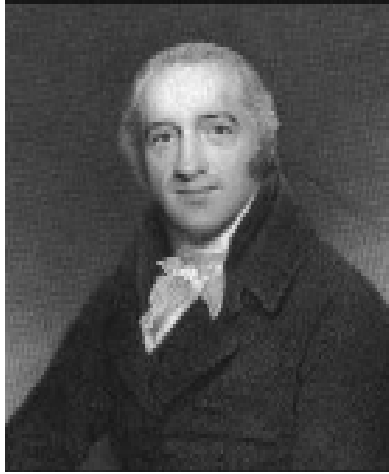
Charles Simeon (1759–1836)